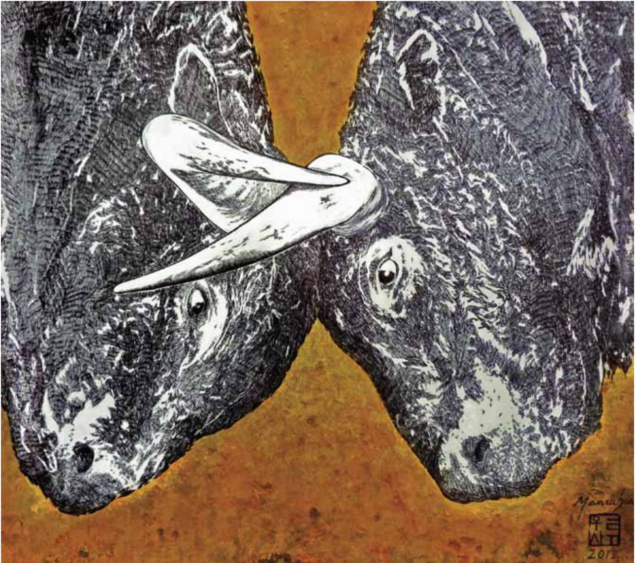
Combat - stylo bille, acrylique et pigments sur papier, 30 x 30 cm, 2012